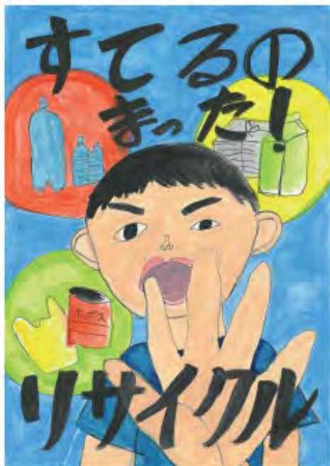
香川県普通寺市立 吉原小学校1年