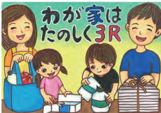
愛知県安城市立 二本木小学校6年