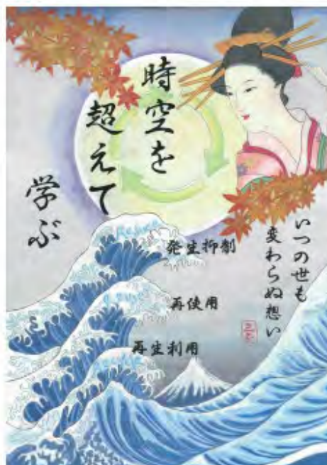
東京都墨田区立 竪川中学校3年