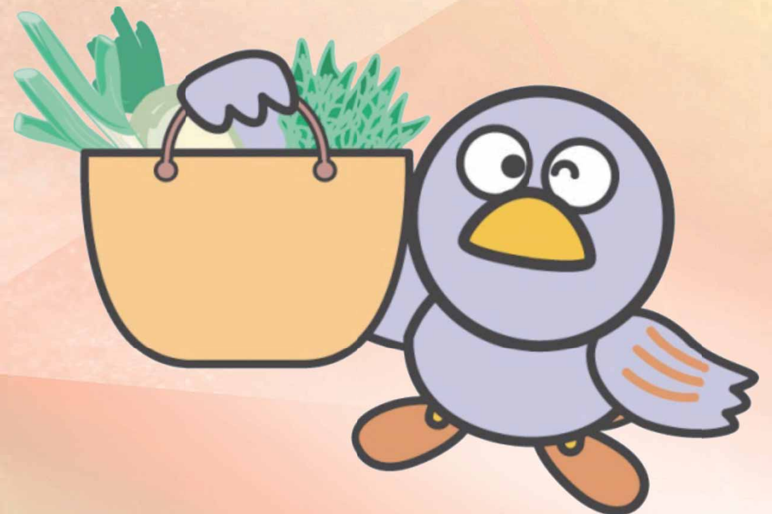
埼玉県のマスコット「コバトン」